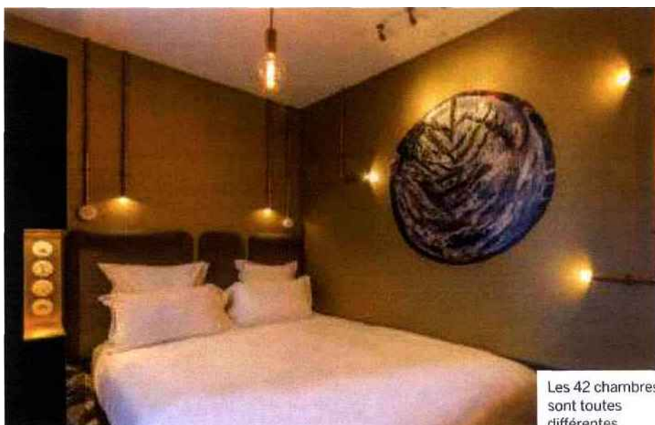
Les 42 chambres sont toutes différentes.